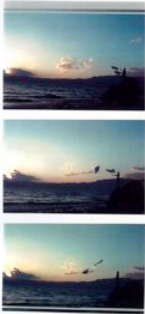
"Aller par la voie des airs" L'Art de feuille de papier de soie, vidéo réalisée sur les fonds du lac Biwa, Japon 1997